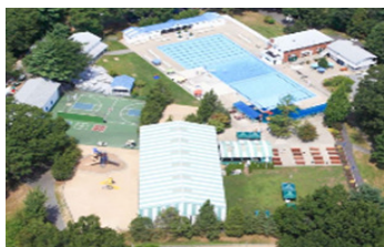
Centro de Cedardale

El 22 de agosto, MassCARE celebró su quinta feria anual de la salud y el bienestar en un