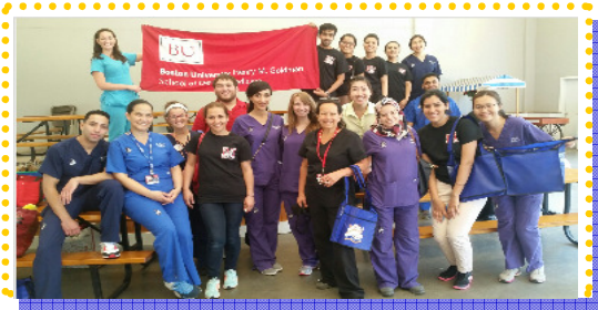
Facultad de Odontología H. M. Goldman de la Univ. de Boston

MassCARE empezó a ofrecer evaluaciones de salud en 2012 y actualmente éstas forman una parte integral de la jornada. Cada año hemos añadido diferentes tipos de evaluación en apoyo a la salud y el bienestar. En agosto, hubo ocho tipos diferentes de evaluación que son relevantes para los clientes de MassCARE: salud bucal, presión arterial, índice de masa corporal, diabetes tipo II, hepatitis, VIH, uso indebido y abuso de alcohol, y salud