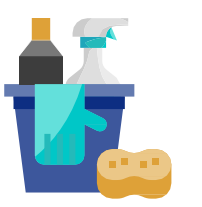
ការលាងសម្អាតនិងការកម្ចាត់មេរោគ

លើកទឹកចិត្តដល់កម្មករដែលងាយរងគ្រោះដោយកូវីដ-១៩ យោងតាមមជ្ឈមណ្ឌលត្រួតពិនិត្យជំងឺ (ឧទាហរណ៍.. ដោយសារអាយុ ឬ លក្ខខណ្ឌមូលដ្ឋាន) ត្រូវស្នាក់នៅផ្ទះ លើកទឹកចិត្តកម្មករដែលមានធាតុសញ្ញា ឬសង្ស័យមានទំនាក់ទំនងជិតស្និទ្ធនឹងអ្នកមានធាតុសញ្ញាកូវីដ-១៩ ត្រូវវាយការណ៍ទៅនិយោជក លើកទឹកចិត្តកម្មករដែលធ្វើតេស្តវិជ្ជមានសំរាប់កូវីដ-១៩ ដើម្បីវាយការណ៍ទៅការិយាល័យនិយោជកក្នុងគោលបំណងសំអាត/កម្ចាត់មេរោគ និងតាមដានរាល់ទំនាក់ទំនង។ លើកទឹកចិត្តវិធីសាស្ត្រទូទាត់ដោយគ្មានទំនាក់ទំនង