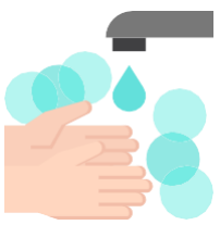
វិធានអនាម័យ

រៀបចំកន្លែងធ្វើការឱ្យមានបរិយាកាសប្រសើរឡើងតាមដែលអាចធ្វើទៅបាន (ឧទាហរណ៍..បើកទ្វារនិងបង្អួច)