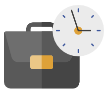
직원 배치 및 운영

근로자에게 위생과 안전 규약을 상기시키는 시각적 표지판을 현장 전역에 비치합니다.