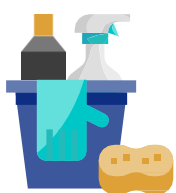
청소 및 소독

현장을 자주 청소하고 소독합니다(최소한 하루 한 번, 가능하면 더 자주).